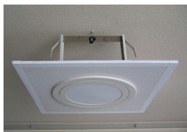
〔防犯用シーリングホール〕