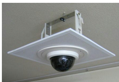
〔防犯監視カメラ付き〕