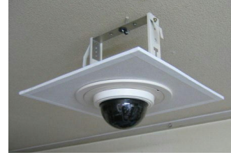
〔防犯監視カメラ付き〕