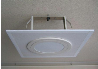
〔防犯用シーリングホール〕