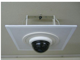
〔防犯監視カメラ付き〕