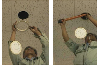
〔現場取付/現場入線〕