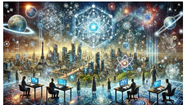
量子もつれとシンクロシティを活用した未来戦略