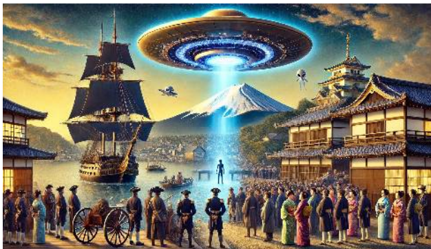
ペリー黒船とUFOの時空を超えたシンクロシティ