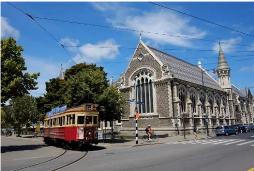
クライストチャーチ