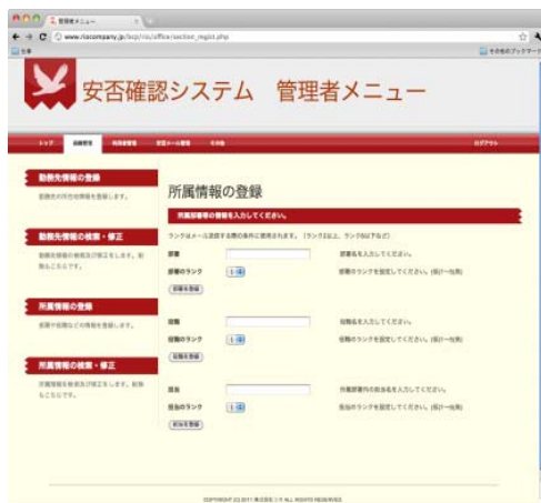
基本情報登録画面

http://www.zetta.co.jp/solution/e_government/bcp.shtml