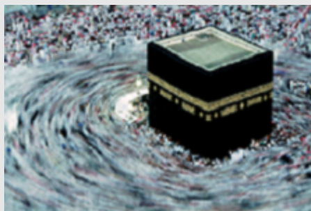
カアバ神殿を反時計回りに7周するタワーフの行(巡回の儀礼)。 サウディアラビア 1995年

218ページ ハードカバー 297×226mm 本体価格 ¥4,000- 税別 ISBN 978-4-904845-22-6 発行所 株式会社クレヴィス