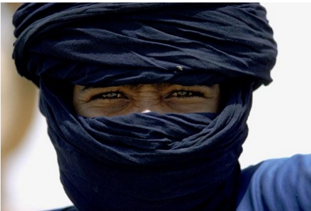
インディゴ・ブルーのベールを着けたトゥアレグ族の青年。アルジェリア 1974年