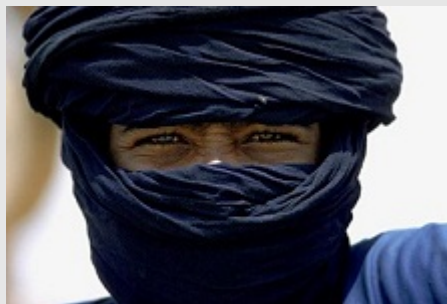
インディゴ・ブルーのペールを着けたトゥアレグ族の青年。 アルジェリア 1974年

リリースファイル http://www.crevis.co.jp/rel/release20121101.pdf 野町氏公式HP http://www.nomachi.com/ クレヴィス 作家紹介ページ http://crevis.co.jp/photographers/artist_14.html