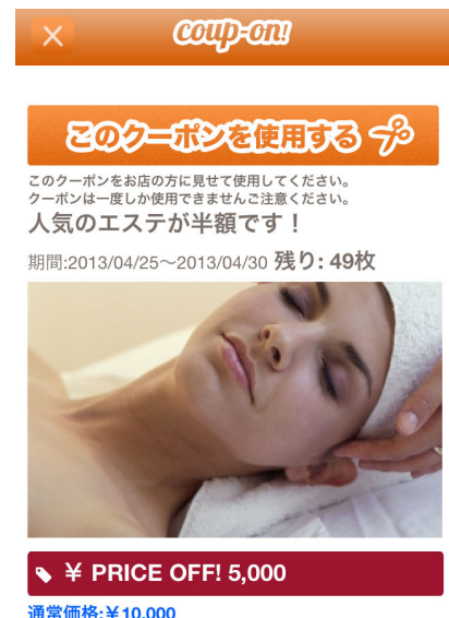
クーポン使用画面