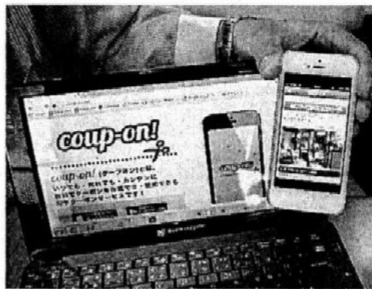
クーポン・オンのクーポン発行アプリは簡単に発行・閲覧できる

ウェブサイトを通じて利用する広告で得る仕組み。事業者はクーポン発行の料金を割り引いたり一部無料にしたりする電子クーポンを発行。ダウンロードしたアプリで利用される見通しという。クーポン