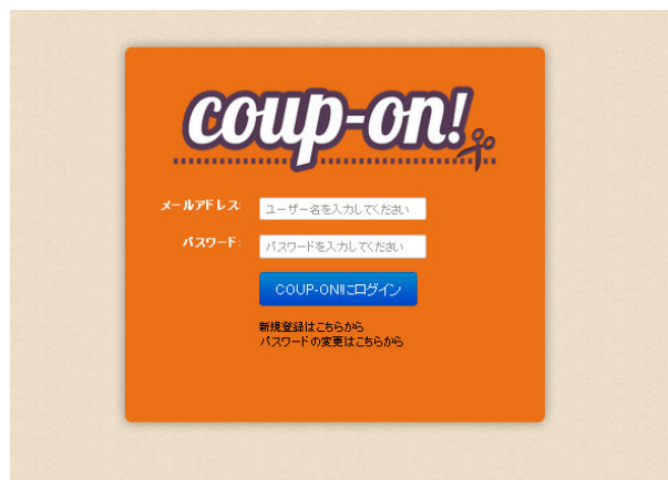
新規事業者登録・ログイン画面

◇0円クーポンの配信も可能ですので、ドリンク無料サービスや記念写真サービスなど、お店の工夫次第で様々なクーポンを作成できます。